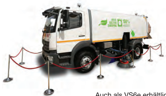
Auch als VS6e erhältlich.